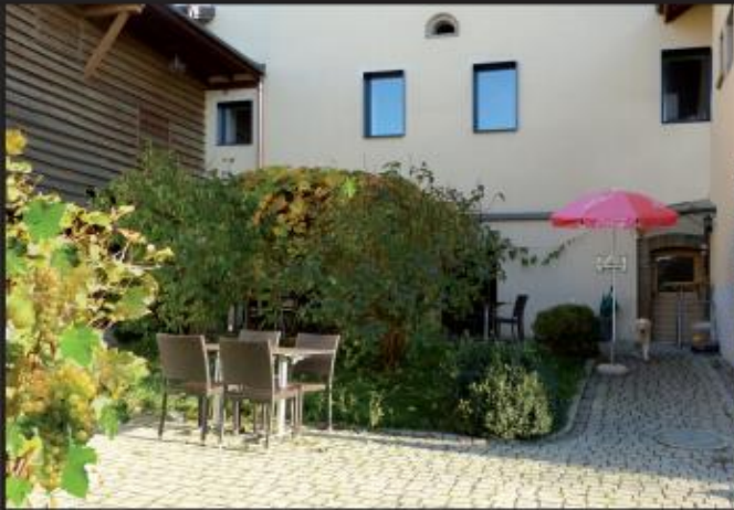
La treille abrite une jolie terrasse

Nous vous accueillerons dans une maison vigneronne de 1802 avec un grand jardin.